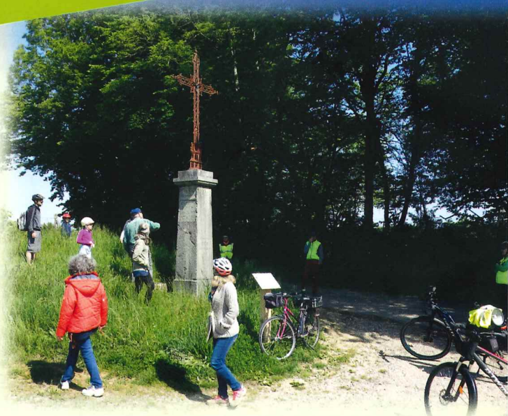
Borne, ancienne route royale, rue du grand Sugny